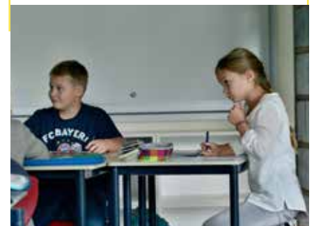
wie Klassenaktionen, Weihnachtsfeier, Faschingsfest oder Lesenacht.

In beiden Jahrgängen ist es möglich, im Rahmen des Musikunterrichts das Spielen von Blasinstrumenten zu erlernen. Diese „Bläserklassen“ werden in Kooperation mit der Musikschule Marburg ausgebildet.