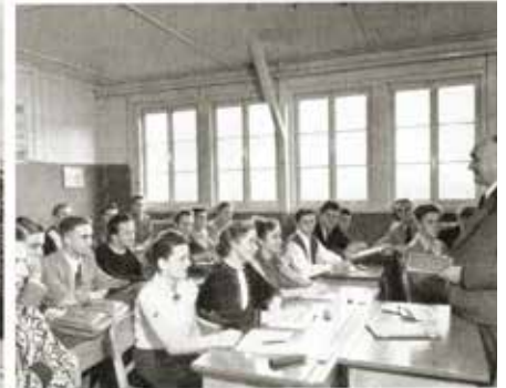
Latein in Oberprima