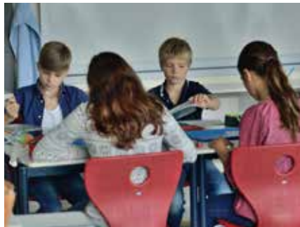
Schülerinnen und Schüler haben Chor und Schwimmen.

Über die hessische Stundentafel hinaus bieten wir bereits im 5. Jahrgang fächerintegrierenden naturwissenschaftlichen Unterricht NaUnt (Biologie, Physik, Chemie und Erdkunde), alle