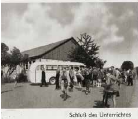
Schluß des Unterrichtes